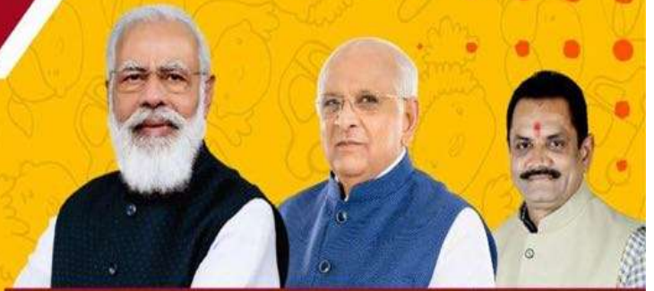
Shri Narendra Modi Prime Minister, Govt. of India

About 5 lakh students of secondary and higher-secondary schools (Standard 9 to 12) can participate in this unique STEM Quiz